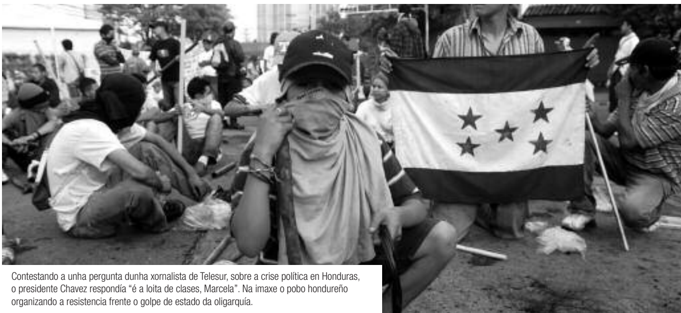
Contestando a unha pergunta dunha xornalista de Telesur, sobre a crise política en Honduras, o presidente Chavez respondía “é a loita de clases, Marcela”. Na imaxe o pobo hondureño organizando a resistencia fronte o golpe de estado da oligarquía.