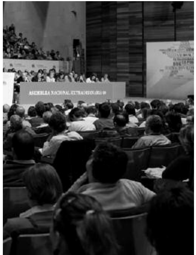
Momento da Asemblea extraordinaria do BNG do pasado mes de maio.

Na Asemblea nacional extraordinaria do BNG, celebrada en maio, como Movemento Galego ao Socialismo (MGS) tivemos voz propia e articulamos un discurso arredor de catro eixos: 1) cambio de rumbo político do BNG (volta ao soberanismo e xiro á esquerda); 2) nova relación cos movementos e organizacións sociais; 3) reactivación orgánica (fomento da participación e da capacidade de decisión da militancia); e 4) mellor articulación da diversidade (pluralismo e unidade; posibilidade incorporar novos sectores do nacionalismo ao proxecto). Así mesmo, fomos quen (malia tratarse dunha asemblea por delegados/as) de promover unha candidatura ao Consello Nacional, denominada Máis Alá!, que obtivo unha representación de dous membros, un dos cales forma hoxe parte da Executiva nacional do BNG. Organismo que, alén da nosa pre-