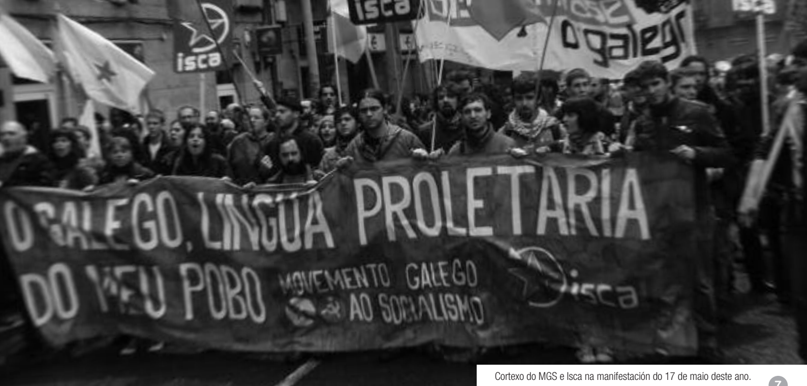
Cortexo do MGS e Isca na manifestación do 17 de maio deste ano.

spirados polo extremismo galegófobo e personalizados no bizarro duo formado polo conselleiro de Educación, Jesús Vázquez, e o secretario-geral de Política Lingüística, Anxo Lorenzo.